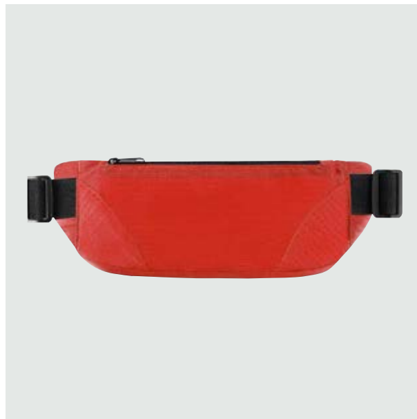
MAL 220 Cangurera Rodman