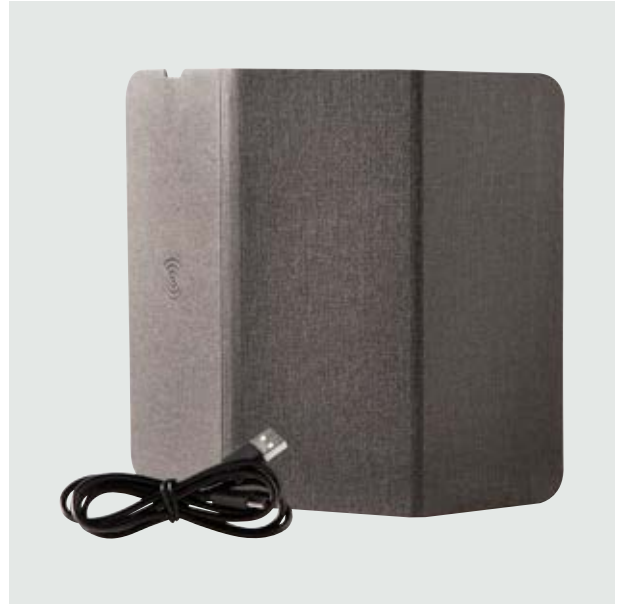
TEC 102 Mousepad Planck