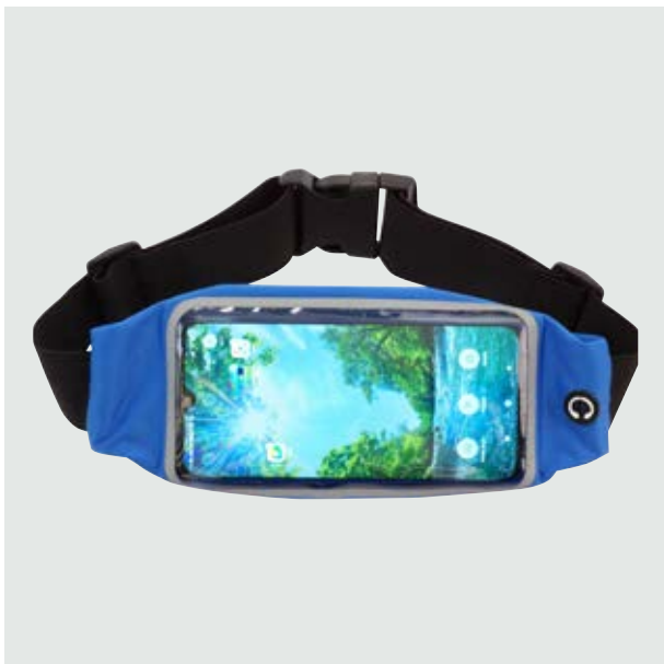
MAL 219 Sport Bag