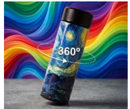
Full Color 360°

Consiste en transferir una pasta espesa de tinta a través de una malla tensada en un marco de madera o metálico. Esta técnica funciona solamente sobre superficies planas.