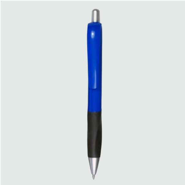
BOL 06 Bolígrafo Fiori