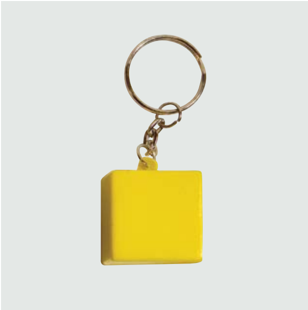
LLA 14 Llaveros Cubic