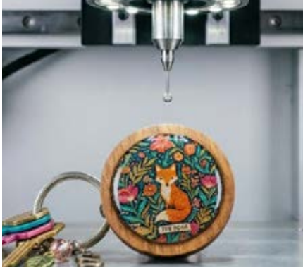
Gota de Resina

Lo anterior da como resultado una personalización impresa o grabada de nuestros productos con alta calidad garantizada.