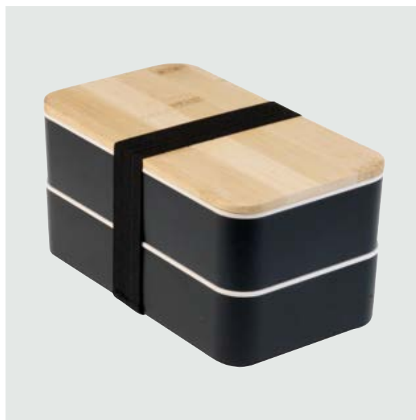
CAS 41 Doble Lunch Box Polaris