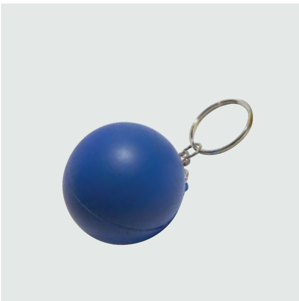
LLA 16 Llaveros Funny