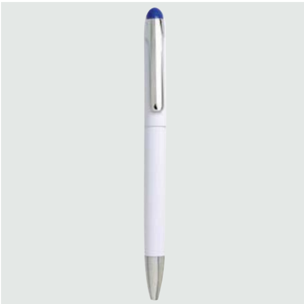
BOL 09 Bolígrafo Luke