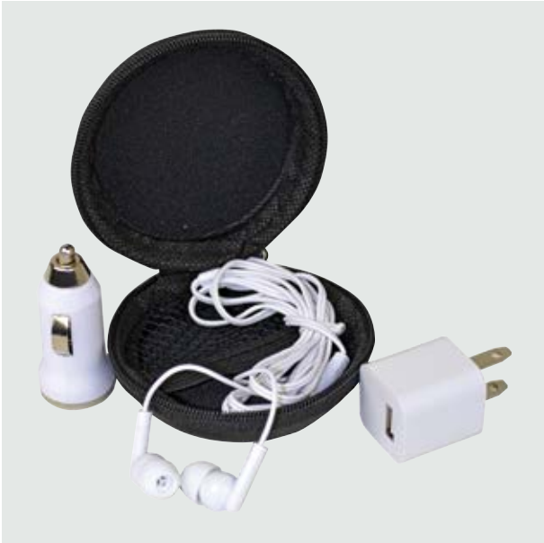
TEC 101 Kit Faraday