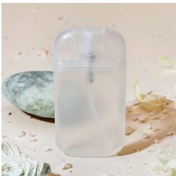
SAL 05 Oxy Sanitizer